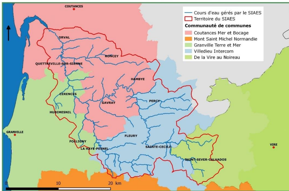
Réalisation : SIAES 2017

Il est présenté ici un programme Bocage sur cinq années.